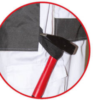
Szlufka na młotek

Spodnie ochronne biały kolor, 80% poliester, 20% bawełna, 190g/m 2 denim, wzmocnienia na kolanach i kieszeniach, regulacja w pasie za pomocą guzików, potrójne szwy na nogawkach, 9 kieszeni ( w tym 6 na rzep), szlufka na młotek, oczko na klucze