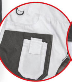
Kieszzeń na smartfona