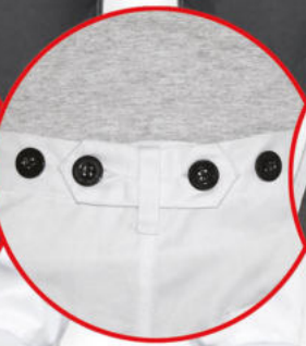
Regulacja w pasie