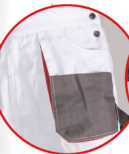
Kieszeń na smartfone'a