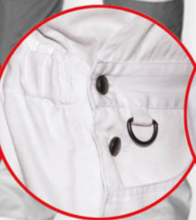
Regulacja w pasie