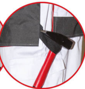
Szlufka na młotek

Spodnie ochronne ogrodniczki, biały kolor, 80% poliester, 20% bawełna, 190g/m 2 , wzmocnienia na kolanach i kieszeniach, regulacja w pasie za pomocą gumki i guzików, potrójne szwy na nogawkach, 9 kieszeni ( w tym 7 na rzep), szlufka na młotek, oczko na klucz