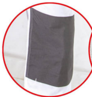
Wzmocnienie materiału na kolanach