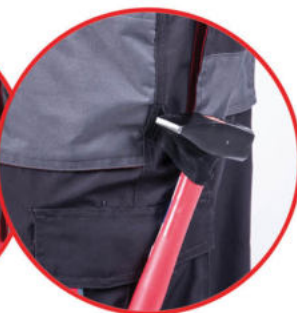
Szlufka na młotek

Spodnie ogrodniczki ochronne 65% poliester 35% bawełna, gramatura 265g/m 2 , potrójne szwy, wzmocnienie materiału na kolanach, regulacja w pasie gumką + guziki, 12 kieszeni (w tym 7 na rzep), kieszeń na smartfone'a, szlufka na młotek, oczko na klucze, szelki z regulacją długości, miejsce na nakolanniki, wszywka identyfikacyjna na „plecach” spodni.