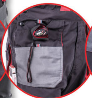
Kieszień na smartfone'a