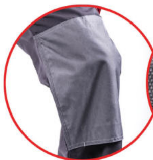
Wzmocnienie materiału na kolanach