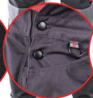
Regulacja w pasie