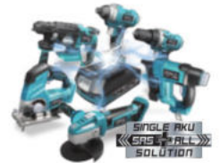
PRODUKT Z SERII DEDRA SAS+ALL DEDRA SAS+ALL SERIES

Max głębokość cięcia/Max szerokość cięcia / Max cutting depth/Max cutting width