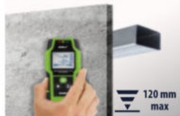
Metale ferromagnetycznych Ferromagnetic metals

PRODUKT POZWAŁA NA WYKRYWANIE W ŚCIANACH LUB SUCHEJ ZABUDOWIE / THE PRODUCT CAN DETECT IN WALLS OR DRYWALL: