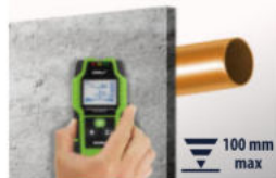
Metale nieżelazne Non-ferrous metals