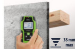
Profile drewniane ( i więcej ) Wooden profiles ( & more )