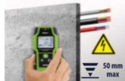
Przewody pod napięciem AC live cables