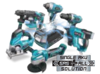
PRODUKT Z SERII DEDRA SAS+ALL DEDRA SAS+ALL SERIES