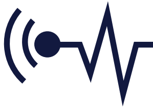
Przód / Front

Detector it's used to find the laser beam emitted by laser devices, which ensures maximum use of their working range.