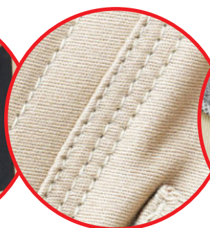
Potrójne szwy Triple stitches