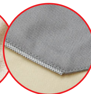
Elementy odblaskowe Reflective elements