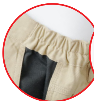
Regulacja w pasie Belt regulation