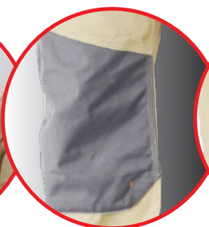
Wzmocnienia na kolanach i kieszeniach Strengthen material on knees and pockets area