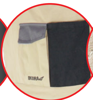
Kieszon na smartfona i wiele innych funkcjonalnych kieszeni/ Smartphone pocket and many other functional pockets